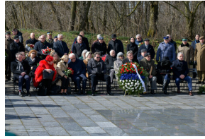
78. rocznica wyzwolenia Stalagu 344 Lamsdorf - Łambinowice, 17 marca 2023.