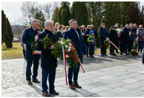
78. rocznica wyzwolenia Stalagu 344 Lamsdorf - Łambinowice, 17 marca 2023.