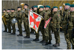
78. rocznica wyzwolenia Stalagu 344 Lamsdorf - Łambinowice, 17 marca 2023.