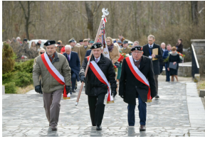
78. rocznica wyzwolenia Stalagu 344 Lamsdorf - Łambinowice, 17 marca 2023.