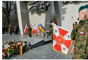
78. rocznica wyzwolenia Stalagu 344 Lamsdorf - Łambinowice, 17 marca 2023.