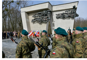
78. rocznica wyzwolenia Stalagu 344 Lamsdorf - Łambinowice, 17 marca 2023.