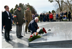
78. rocznica wyzwolenia Stalagu 344 Lamsdorf - Łambinowice, 17 marca 2023.