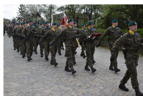
Obchody Dnia Flagi RP oraz 102. rocznicy