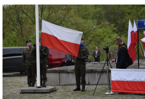
Obchody Dnia Flagi RP oraz 102. rocznicy