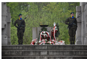
Obchody Dnia Flagi RP oraz 102. rocznicy wybuchu III Powstania Śląskiego - Góra Świętej Anny, 2 maja 2023.