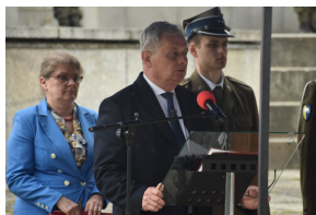
Wojewoda opolski Sławomir Kłosowski.