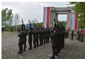
Obchody Dnia Flagi RP oraz 102. rocznicy wybuchu III Powstania Śląskiego - Góra Świętej Anny, 2 maja 2023