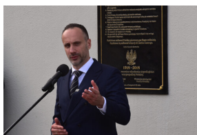
Wiceminister Rolnictwa i Rozwoju Wsi Janusz Kowalski.