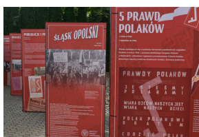
Wystawa „»Jesteśmy Polakami«. Związek Polaków w Niemczech”.