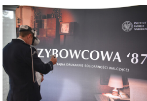
„Szybowcowa ‘87”. Wirtualna drukarnia Solidarności Walczącej.