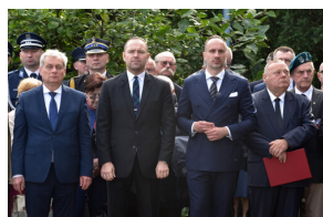
Odsłonięcie pomnika Wojciecha Korfanteo - Opole, 11 października 2023.