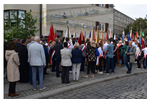
Odsłonięcie pomnika Wojciecha Korfanteo - Opole, 11 października 2023.