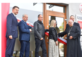
Uroczyste otwarcie nowej siedziby Instytutu Pamięci Narodowej w Opolu.