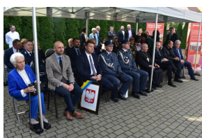
Uroczyste otwarcie nowej siedziby Instytutu Pamięci Narodowej w Opolu.

Nowa siedziba znajduje się kilkaset metrów od niedawno otwartego Centrum Usług Publicznych przy ul. płk. Witolda Pileckiego 1. W nowoczesnym, dwupiętrowym budynku będą znajdować się pomieszczenia edukacyjne, warsztatowe oraz sala konferencyjna. Nowa przestrzeń pozwoli na realizację funkcji naukowych i edukacyjnych na dużo wyższym poziomie. Nowoczesna siedziba Delegatury będzie służyć mieszkańcom Opola i województwa opolskiego a także stanie się miejscem opolskiej edukacji historycznej. Budynek jest dostosowany do potrzeb osób niepełnosprawnych. Będzie to pierwsza samodzielna siedziba IPN w Opolu. Dotychczas znajdowała się ona w Instytucie Śląskim.