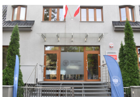
Uroczyste otwarcie nowej siedziby Instytutu Pamięci Narodowej w Opolu.