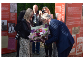
Uroczyste otwarcie nowej siedziby Instytutu Pamięci Narodowej w Opolu.