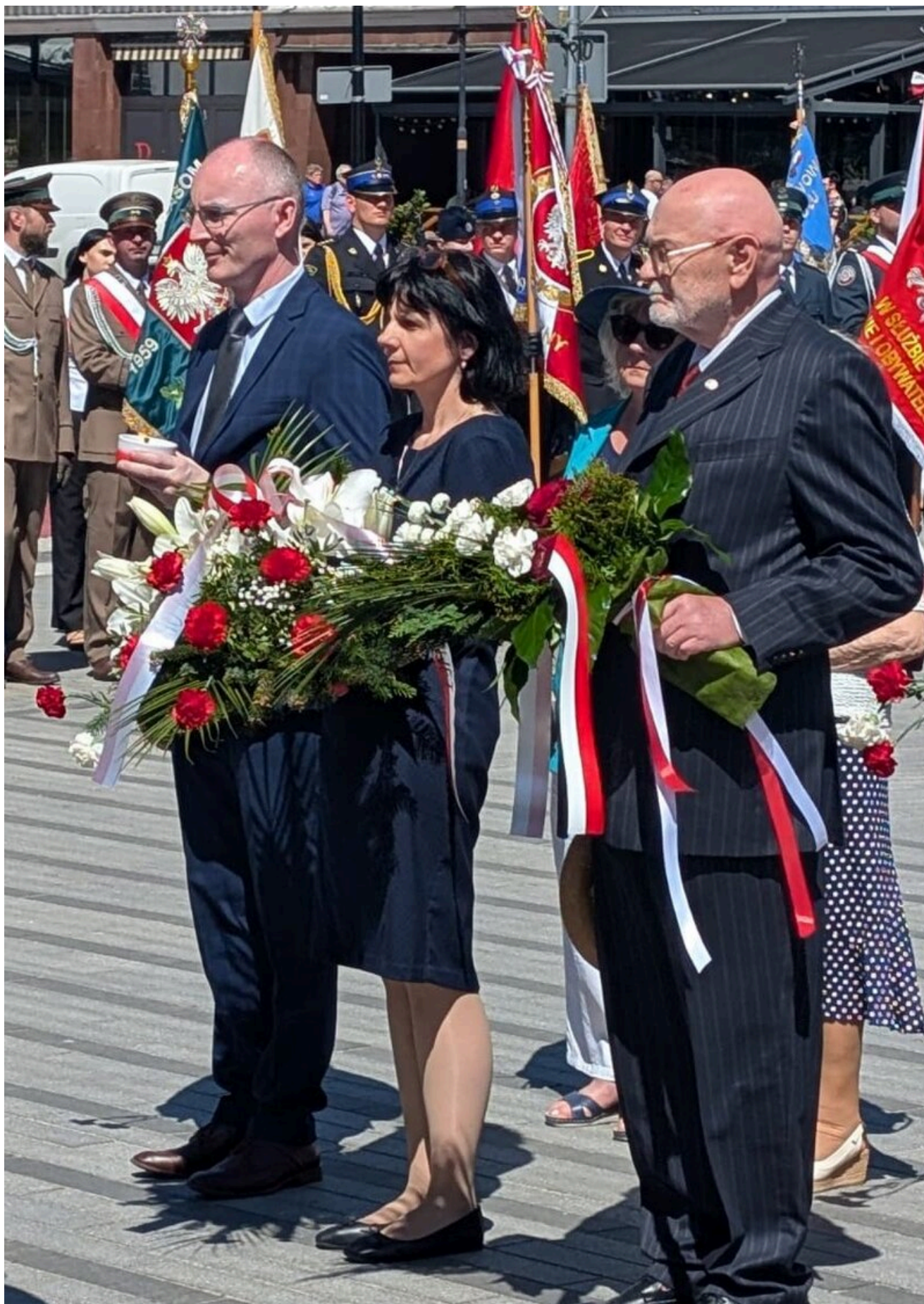
Święto Narodowe Trzeciego Maja - Opole, 3 maja 2026