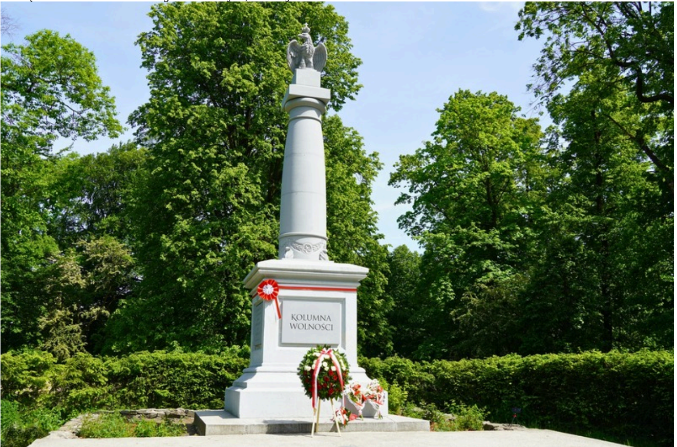
Pamięci rtm. Witolda Pileckiego - Głubczyce, 25 maja 2026