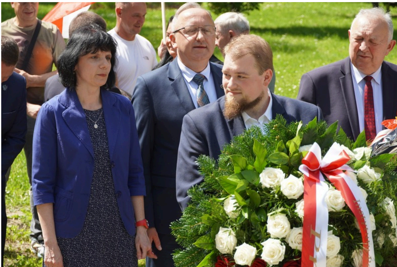
Pamięci rtm. Witolda Pileckiego - Głubczyce, 25 maja 2026

Obchody rozpoczęło złożenie kwiatów pod Kolumną Wolności w Głubczycach, gdzie oddano hołd wszystkim, którzy walczyli o wolność i niepodległość Polski. Kwiaty złożyła m.in. delegacja Instytutu Pamięi Narodowej.