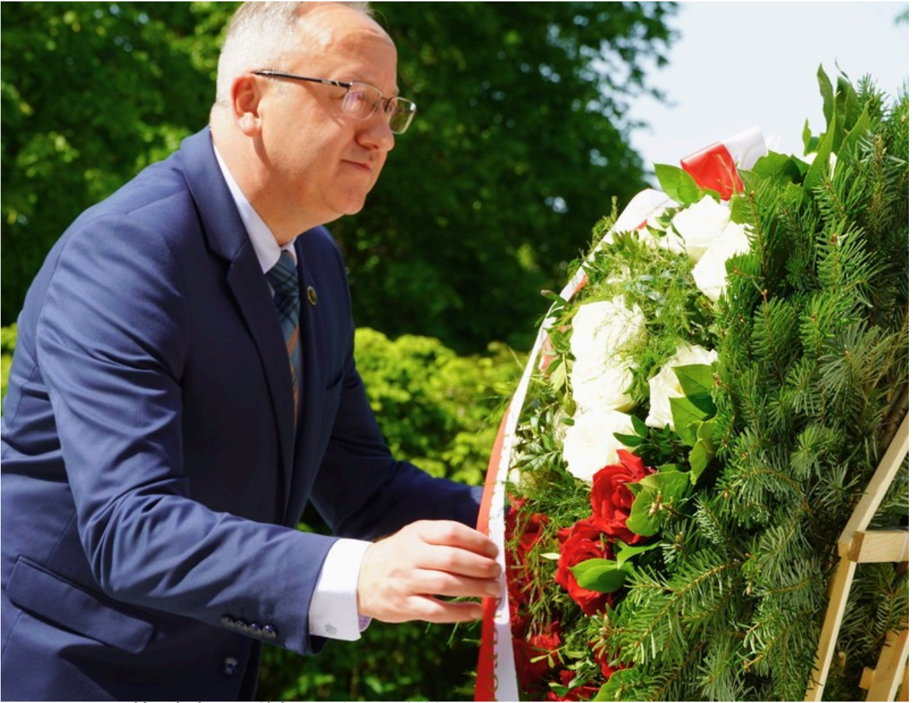
Pamięci rtm. Witolda Pileckiego - Głubczyce, 25 maja 2026